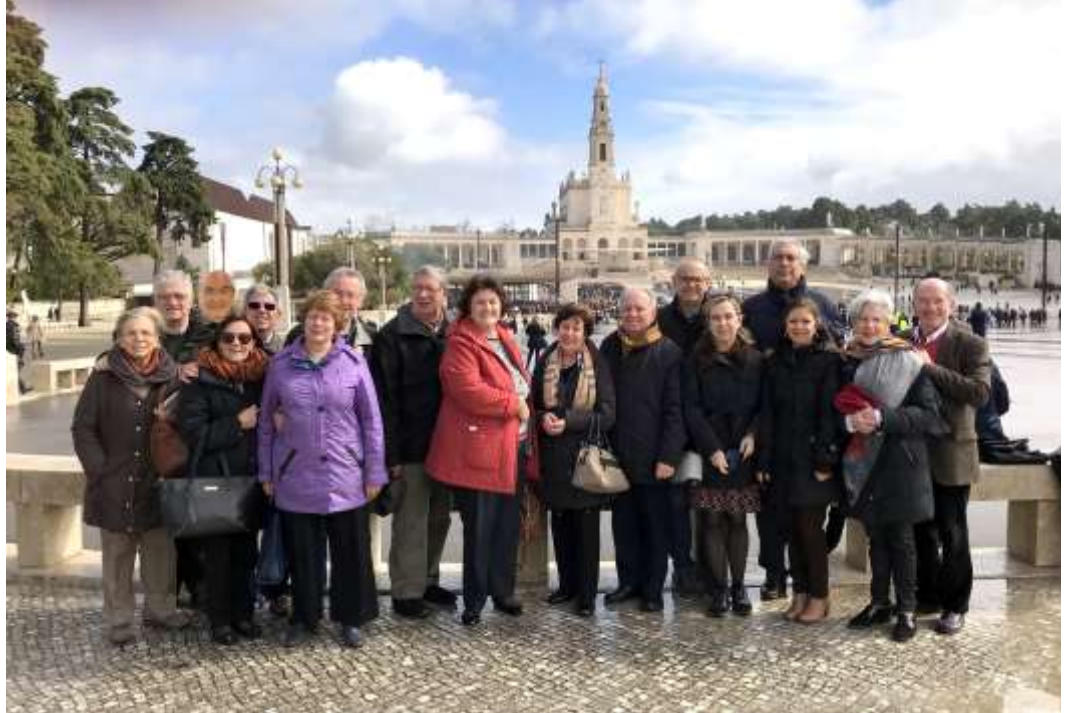
El ERI delante de la explanada del Santuario de Fátima

La Súper-Región Portugal acogió al ERI con mucha gentileza, amistad y eficacia. Le felicitamos y agradecemos calurosamente !!!